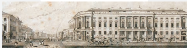
V. Sadovnikov: Polizeibrücke, Nevski Prospekt (Fragment) 1830

Zu sehen sind Stadtansichten aus der ersten Hälfte des 19. Jahrhunderts des Russischen Puschkin-Museums St. Petersburg. Gleichzeitig werden deutsche Übersetzungen von Werken Puschkins aus privaten Beständen der Deutschen Puschkin-Gesellschaft präsentiert. Salonmöbel des 19. Jahrhunderts , die das Auktionshaus Eichelkraut aus Potsdam zur Verfügung stellt, runden die Ausstellung ab.